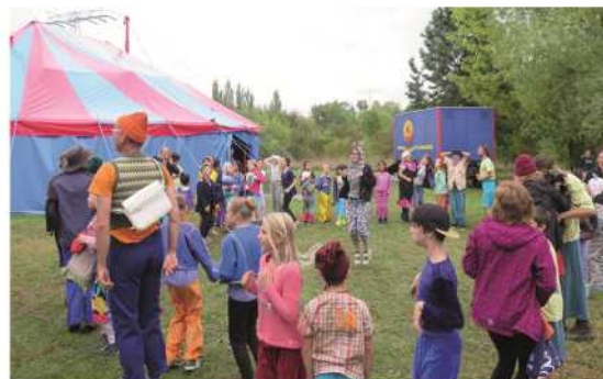
Bild 6: Die alljährlichen Kinderfeste werden von vielen Kindern erwartet