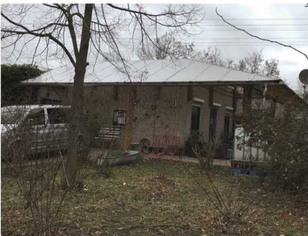
Bild 17: Blick auf das Gebäude des "Jugendclub Nordlicht" im Dezember 2019

Es gab und gibt, das ist für jedermann erkennbar, viel zu tun im "Jugendclub Nordlicht". Und auch zu Beginn des Jahres 2020 warten viele Aufgaben auf die Akteure. Anstehende Veranstaltungen wie ein gemeinsames Stadtteilstfest mit der GWG, ein Volleyballturnier, der nächste Skatecontest, die Teilnahme am Thüringer Ferienpass und verschiedenen Workshops (z.B. zu Fragen der Drogenprävention oder zur sexuellen Aufklärung) wollen gemeistert werden.